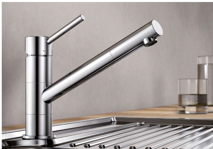
BLANCO KANO kovový povrch