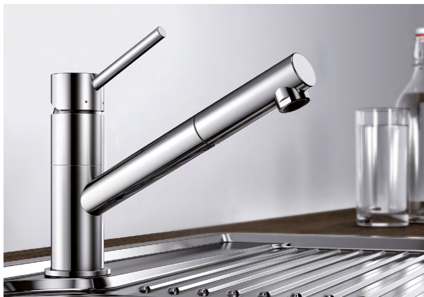
BLANCO KANO-S kovový povrch