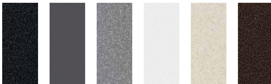
antracit šedá skála aluminium bílá jasmín kávová