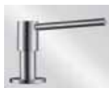
nerez masiv kartáčovaný 517 537