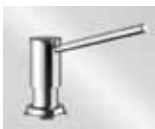
chrom 521 291